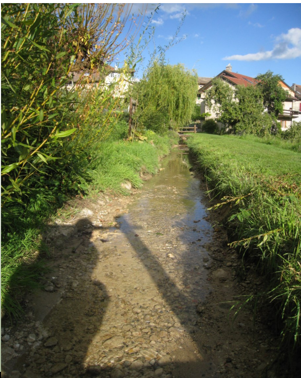
Canal après curage